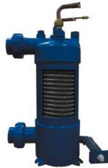
Echangeur en titane avec tube twisté Titanium warmtewisselaar met een buis "twisted"